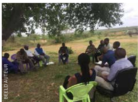
← Keniaanse huisartsen in opleiding, hun Nederlandse supervisors en vertegenwoordigers van de lokale bevolking spreken over de verbetering van preventie.

munity oriented primary care -model combineert de huisarts dus klinische zorg met public health . 2